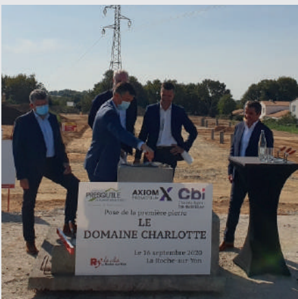
Pose de la 1 ère pierre le 16/09/2020

Mi-septembre, La Compagnie du logement et le promoteur immobilier Axiom ont inauguré le début des travaux de construction d'un programme de logements neufs.